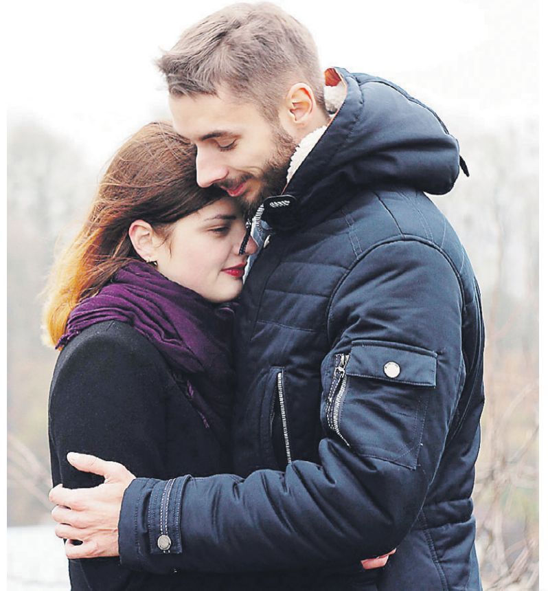
Стереотипы о мужчинах в наше время уже неактуальны

Чем больше человек занимался развитием, тем больше в нем противоречий