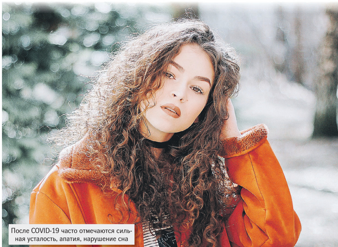
После COVID-19 часто отмечаются сильная усталость, апатия, нарушение сна