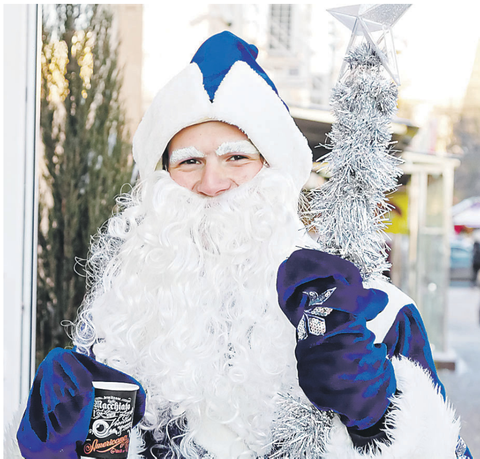
В Новый год дети радуются Деду Морозу, а взрослые — возможности побыть им

Большинство людей в небольшой промежуток времени хотят вместить невместимое.