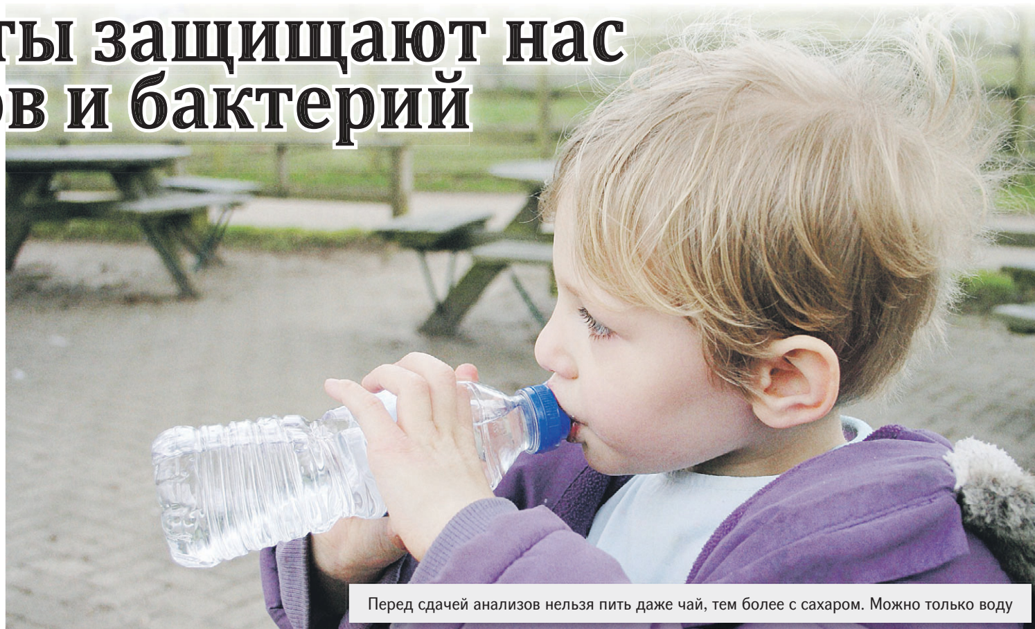
Перед сдачей анализов нельзя пить даже чай, тем более с сахаром. Можно только воду