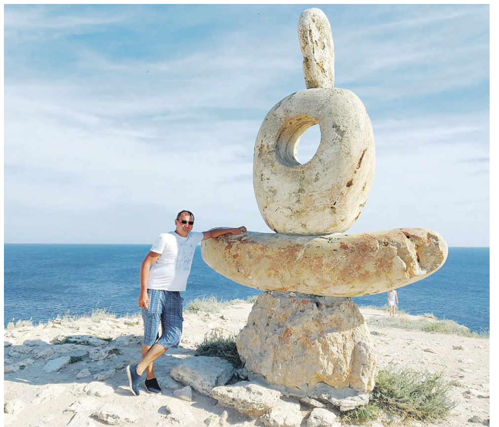
Мыс Тарханкут. Именно здесь снимали знаменитый фильм «Человек-амфибия». Статуя «Мыслитель»

ник ни в чем не повинным туркам, которых вырезали русские оккупационные войска под предводительством военного преступника Суворова?