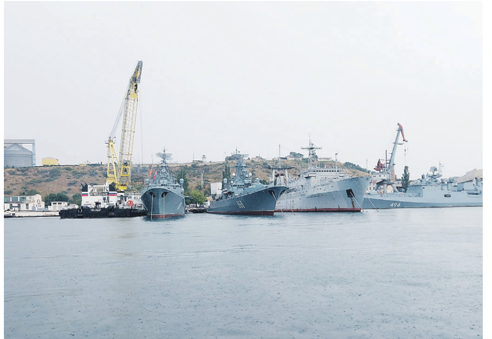
Во время морской прогулки в Севастополе

Что было бы сейчас во Владимирском соборе и прилегающих к нему территориях? Памят-