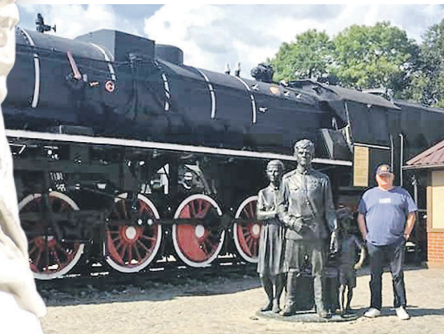
Памятник первым переселенцам в Советске

Жители Калининградской области — весьма интересный народ. С одной стороны, они вроде бы русские. А с другой — ничего нашего они с собой не привезли. Наоборот, за время проживания на бывшей прусской земле в них стало прорастать нечто европейское. Вместо привычных нам домовых здесь верят в хомлинов: эти маленькие мифические существа давно стали символом Калининграда. У нас на рекламных вывесках пишут «Русские окна». А у них — «Прусские окна». Названия ресторанов — через одно на немецком. Кухня — отдельная тема. Мужики здесь едят немецкие колбаски и пьют пиво с кислой капустой.