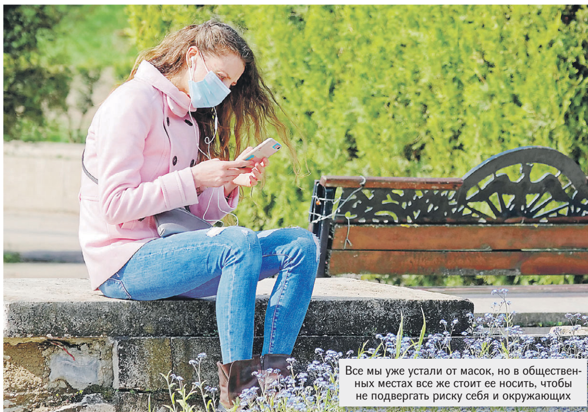
Все мы уже устали от масок, но в общественных местах все же стоит ее носить, чтобы не подвергать риску себя и окружающих

Можно ли заниматься спортом, сделав прививку, какие вакцины есть в наличии и что такое цитокиновый шторм.