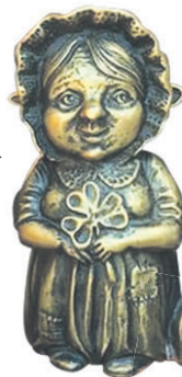
Хомлины (домовые по-нашему) являются символом Калининграда

Удивляет поразительная предприимчивость калининградцев. К примеру, была фабрика, где требовалось большое количество пара. Один делец предложил: давайте я обеспечу вас паром на несколько лет, только подпишите со мной договор. Они подписали. Он купил в Швеции подержанный пароход, поставил его котельную рядом со стеной фабрики и таким образом разбогател. А еще калининградцы переняли европейскую привычку чуть что — судиться. Говорят, у них в среднем в пять раз больше адвокатов на душу населения, чем в среднем по России.