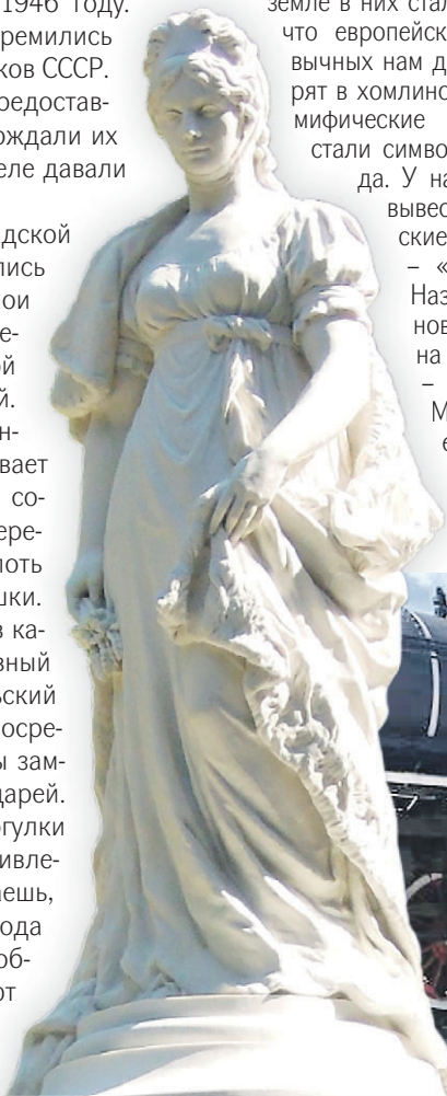
В центре Советска стоит памятник прусской королеве Луизе

На калининградской земле переплелись культурные слои трех эпох — немецкой, советской и постсоветской. И эта тройственность проглядывает везде. Вроде бы советские власти переименовали все вплоть до каждой речушки. Но ты заезжаешь в какой-нибудь условный поселок Октябрьский и вдруг видишь посреди него развалины замка тевтонских рыцарей. Или во время прогулки по Советску с удивлением обнаруживаешь, что в центре города непостижимым образом соседствуют памятники прусской королеве Луизе и вождю мирового пролетариата Ленину.