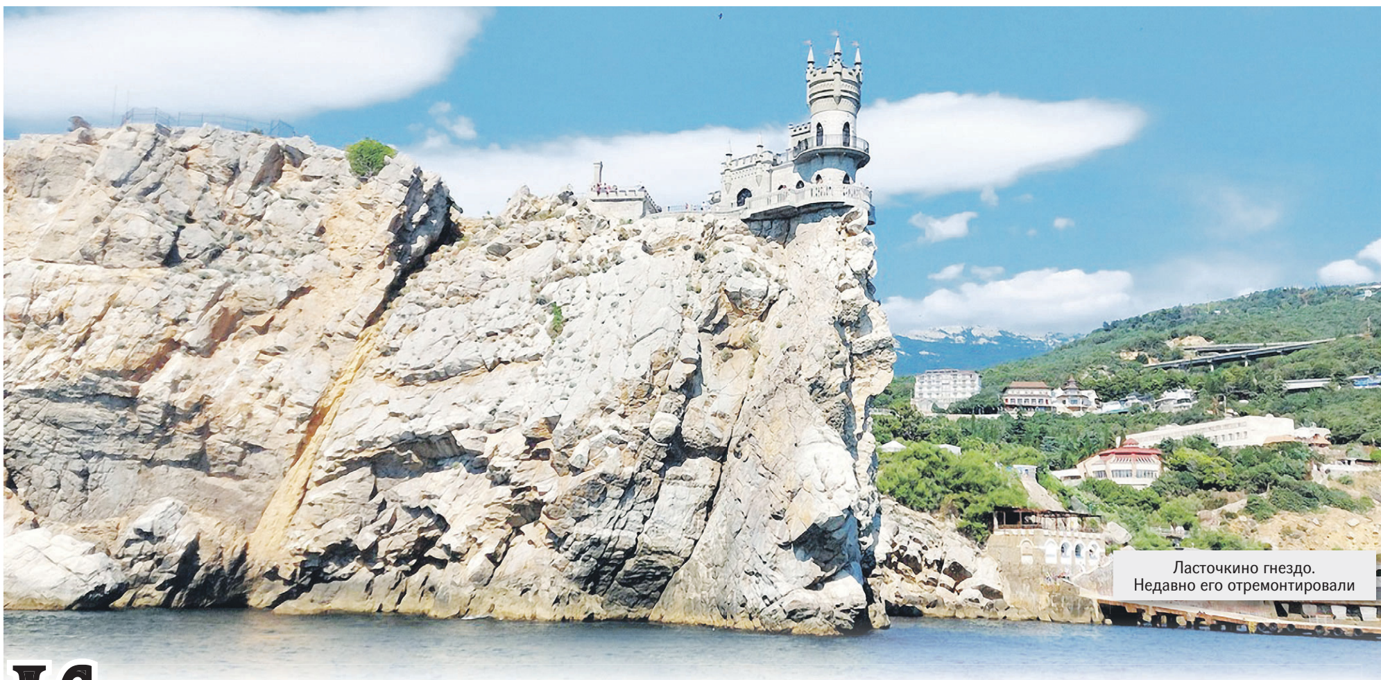
Ласточкино гнездо. Недавно его отремонтировали