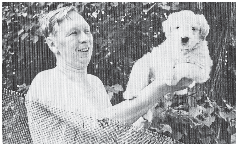
«Сельскому врачу верят, это многое значит»

Большинство лечебно-профилактических мероприятий в больнице старались проводить зимой, понимая, что в остальное время года у селян и без того предостаточно забот. Система профилактики охватывала бригады, фермы, школы. Раз в месяц врачи-терапевты выезжали на свои участки для приема больных. Раз в год работники совхозов проходили профилак-