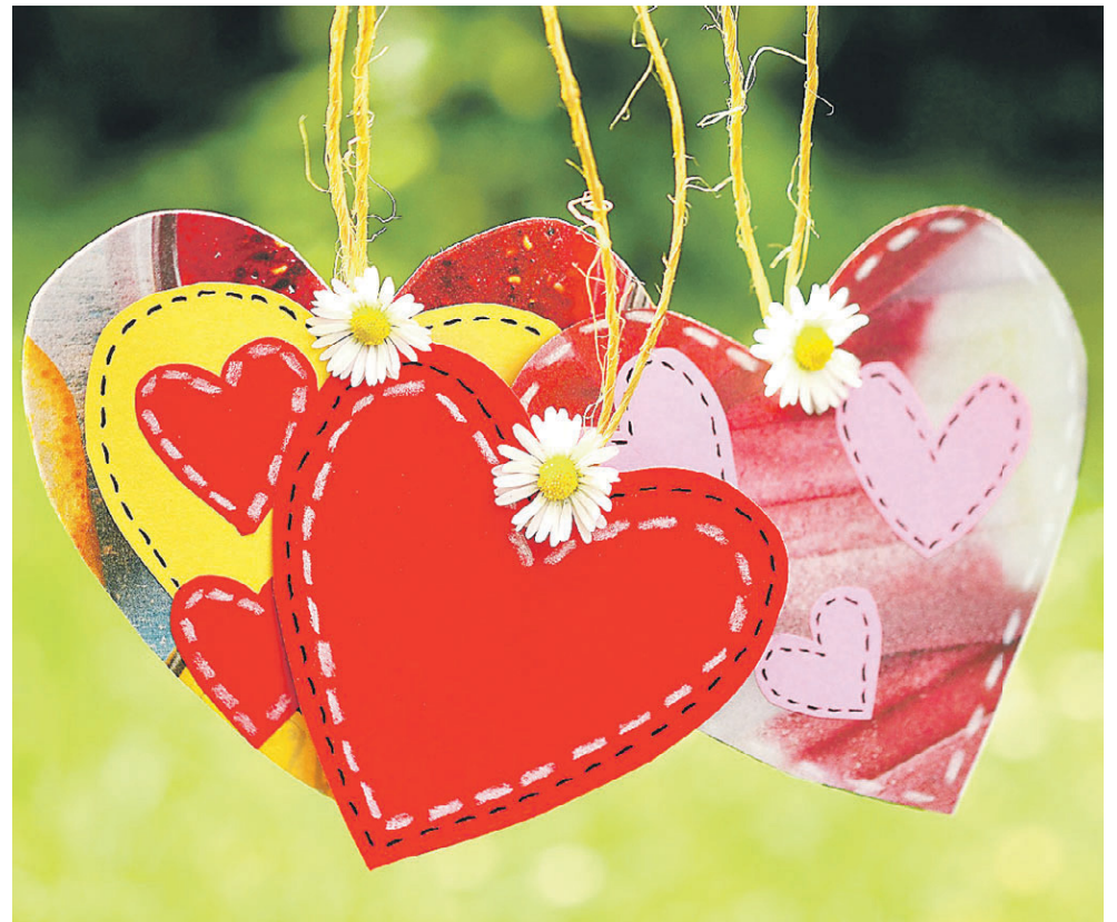
Особенно важно позаботиться о сердце людям после 40 лет

и обострение сердечно-сосудистых заболеваний. Важно воспитывать у себя стрессоустойчивость. Больше позитива в жизни, доброты, дружелюбия. Надо стараться избегать информационного стресса: продолжительного пребывания за компьютером, телевизором. Обязательно высыпайтесь! Сон должен быть не менее 7–8 часов. При хроническом недосыпании вырабатывается белок, повреждающий сосуды. Ради здоровья откажитесь от курения! Избегайте пассивного курения. Придерживайтесь правила: минимум алкоголя.