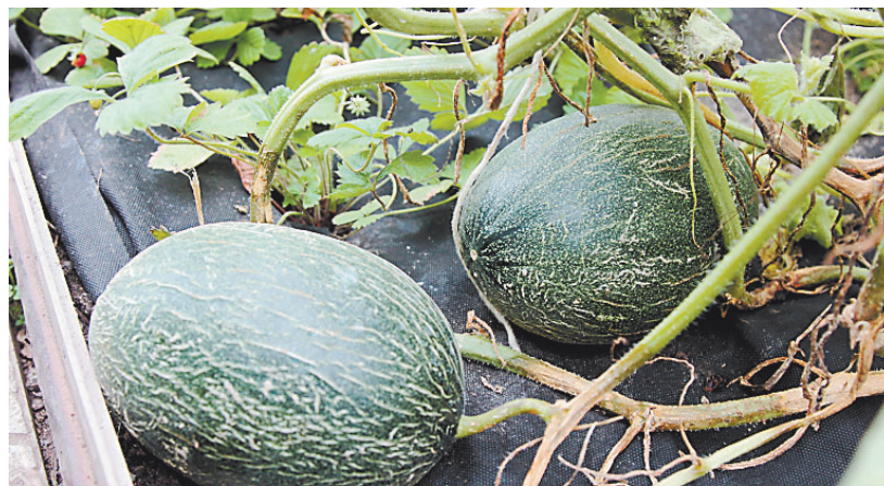
Сладкие и сочные дыни растут в теплице