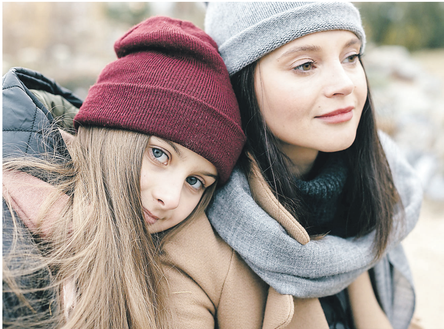
Осень требует более бережного отношения к себе и близким

терять работу. Работы немерено! Другое дело, что у нас есть свои представления о ней: этим я заниматься не буду, туда не пойду. Нас Вселенная вообще-то не всегда спрашивает, хотим мы чего-то или не хотим: она предлагает, а мы либо берем, либо нет. Если мы защищаем невротизм в людях, то да, все боятся потерять работу, и пусть дальше боятся. Любое недовольство происходящим – это невроз. Когда человека что-то не устраивает, это невроз.