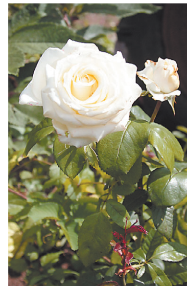
Для роз садовод делает легкое укрытие на зиму