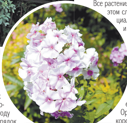
Яркие флоксы в саду