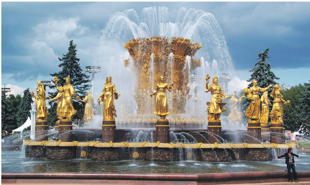
Роман «Суперхан» – это попытка проанализировать, какое общество было построено на обломках Советского Союза.

Новая книга – роман «Суперхан» – задала поколенческой саге и новый век-