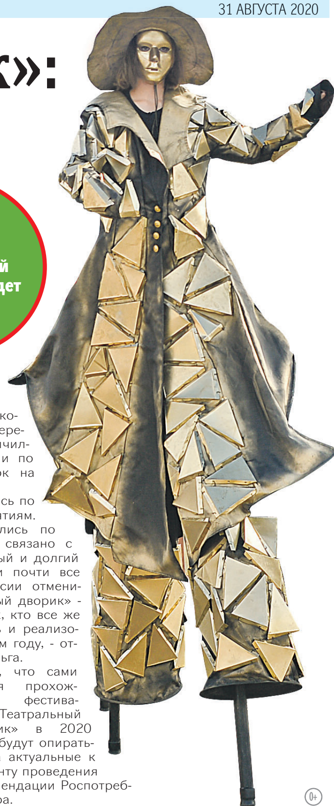
Ангелина КОЛОМЫЦЕВА.