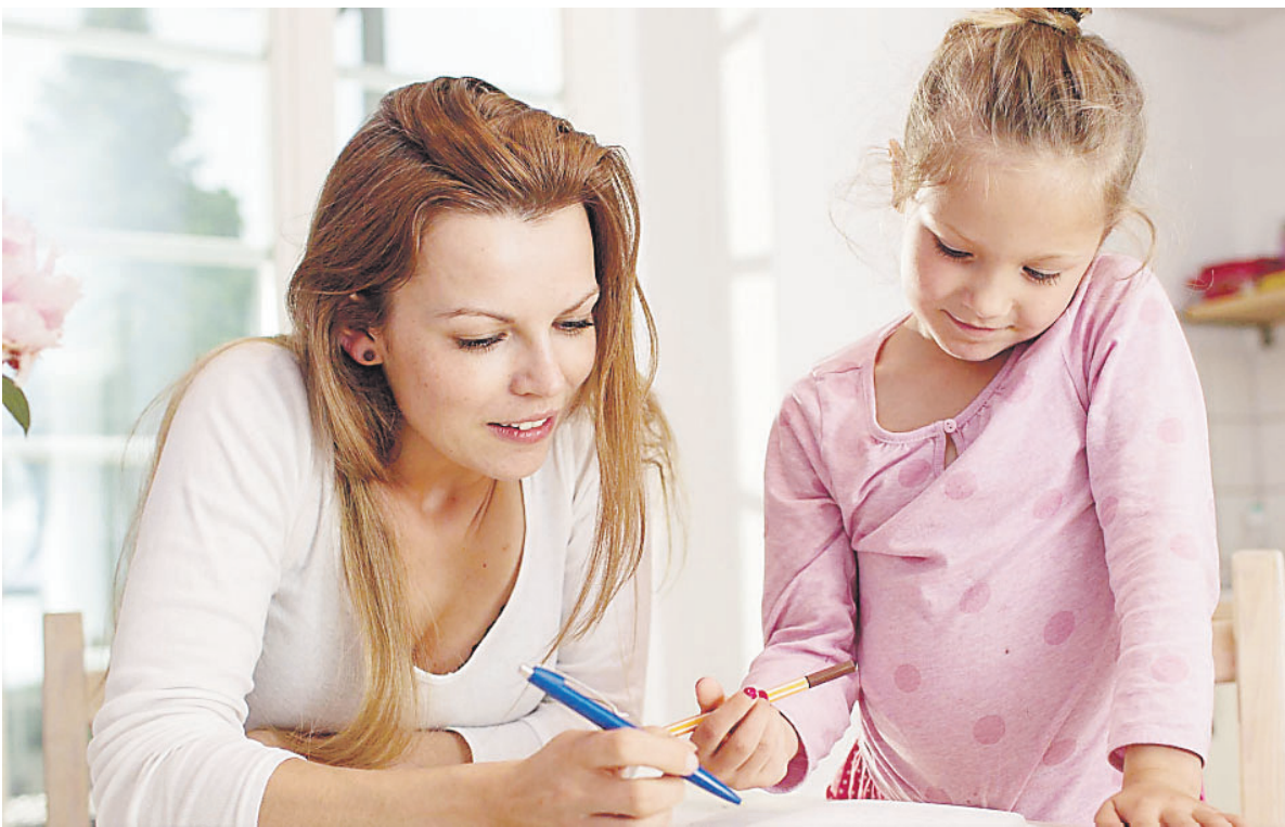
Помогать детям надо, но не делать за них уроки