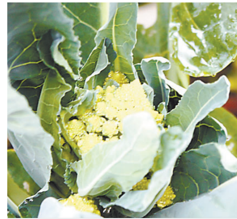
Капуста пока никак не «завездится»

Говорят, что настоящий мужчина в своей жизни должен сделать три вещи: построить дом, посадить дерево и воспитать сына. Все эти «подвиги» пришлось в одиночку совершить героине нашей сегодняшней публикации. Сын давно вырос, дом построен, собственноручно посаженные деревья неплохо плодоносят.