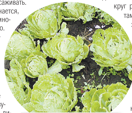
Пекинская капуста «чача»

Всходы дала и пекинская капуста «чача», а вот урожая все еще нет. «Чача» – прихотливое растение, требующее ранней посадки еще в марте. Чтобы образовался полноценный кочан, почву надо постоянно рыхлить и поливать. Но дачница не отчаивается: сезон продолжается, возможно, в конце концов, «чача» отправится туда, где ей самое место – в салат.