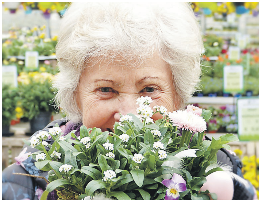
Сохранить иммунитет помогут положительные эмоции

Чтобы улучшать и укреплять иммунитет, нужно вести здоровый образ жизни. Большое значение имеет правильное питание. Как переизбыток, так и голодание сильно бьют по здоровью. Для нормальной работы иммунной системы необходим белок, поэтому в свой рацион надо включать