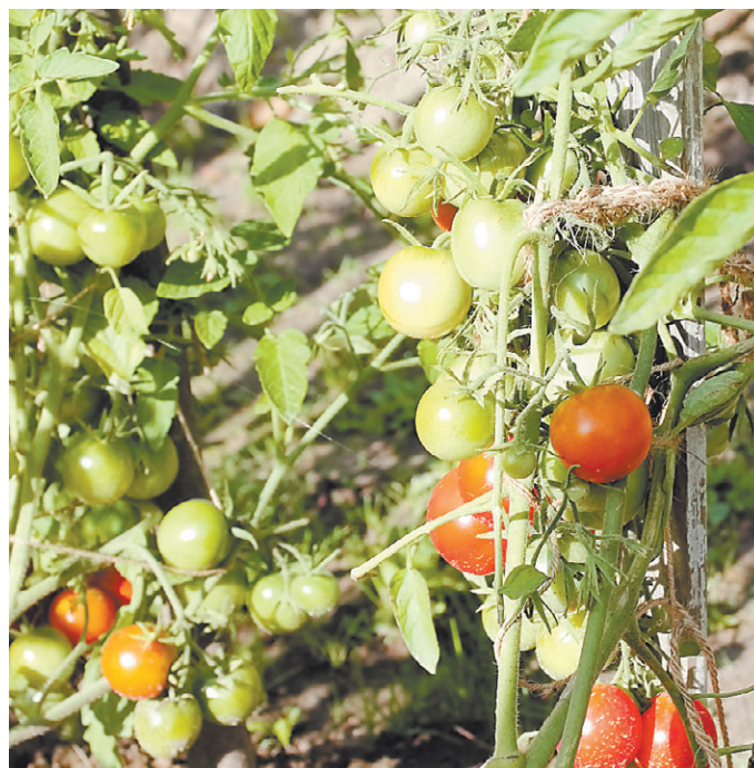
Раннеспелые томаты позволяют уйти от фитофторы