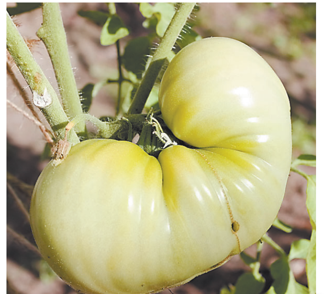
Томат Казахстанский желтый