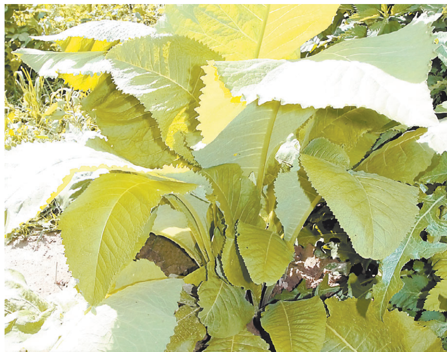
Грядка с полбой