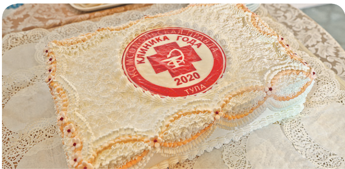
Кульминацией мероприятия стал уникальный торт от ООО «Тульский хлебокомбинат», который предприятие подготовило специально для праздника