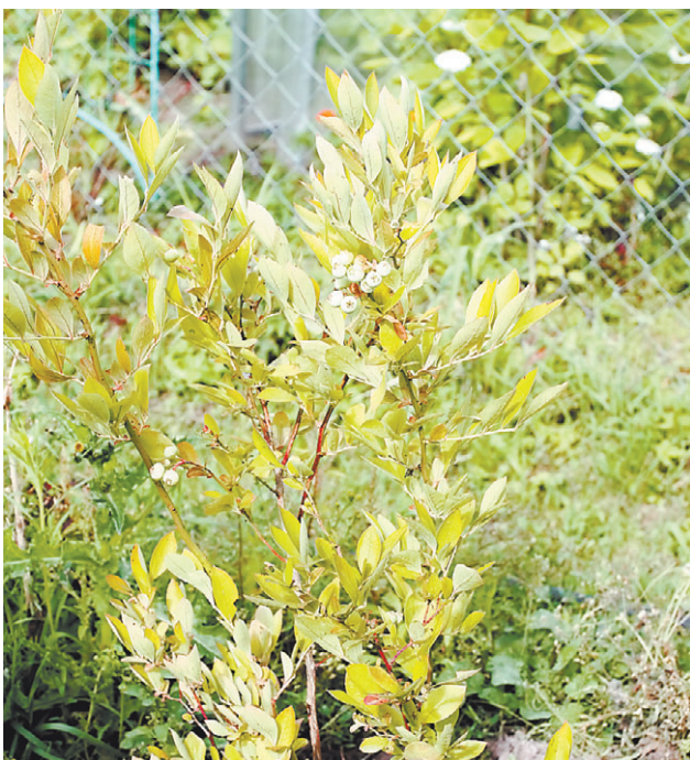
Голубика – сложное в уходе растение