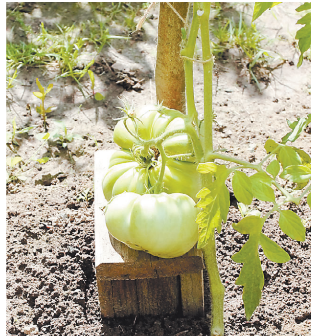
Сорт Шилленберга любимые дает настолько крупные плоды, что для них делают специальные подпорки