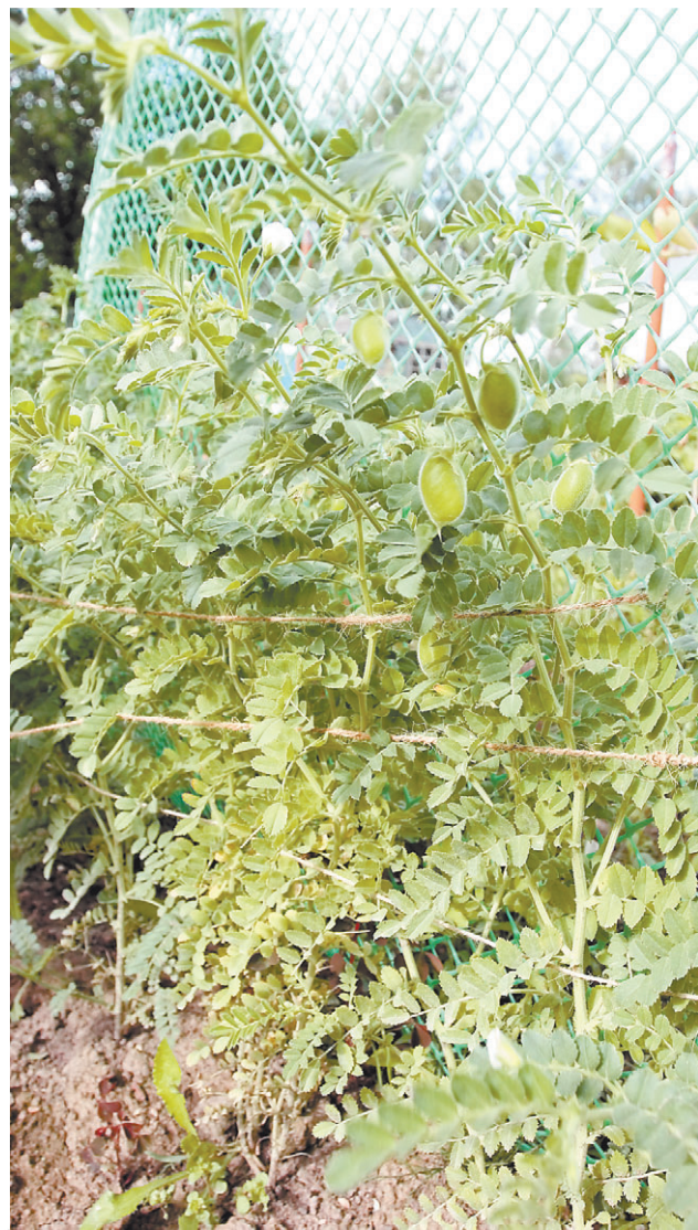
Так растет бараний горох