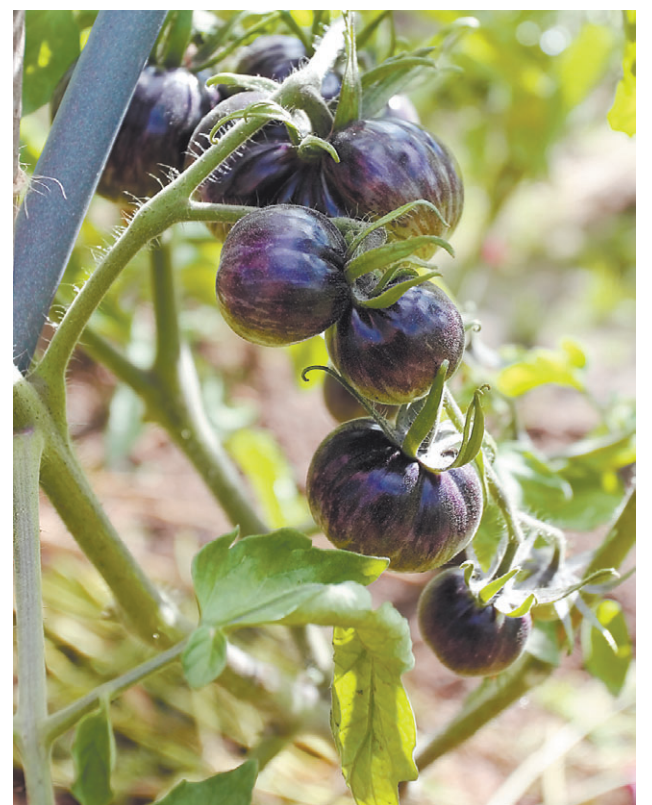
Синие томаты на пике моды. Озарк восход